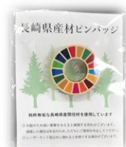
ポリプロピレン袋、台紙入り